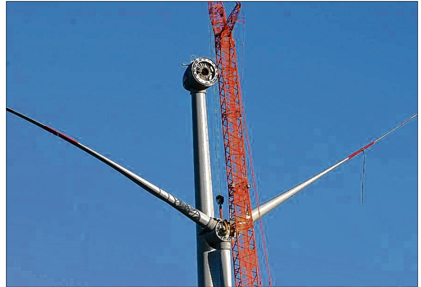
Teuer und zeitraubend: Herkömmliche Servicearbeit an Windrädern erfolgt mit einem Raupenkran.

Auch das Bundesministerium für Wirtschaft und Energie (BMWi) ist vom wirtschaftlichem Erfolg der Erfindung überzeugt und unterstützt daher das Projekt mit einer Zuwendung von 1,6 Millionen Euro. Läuft alles nach Plan, könnten schon 2020 die ersten Kletterroboter in Aktion sein.